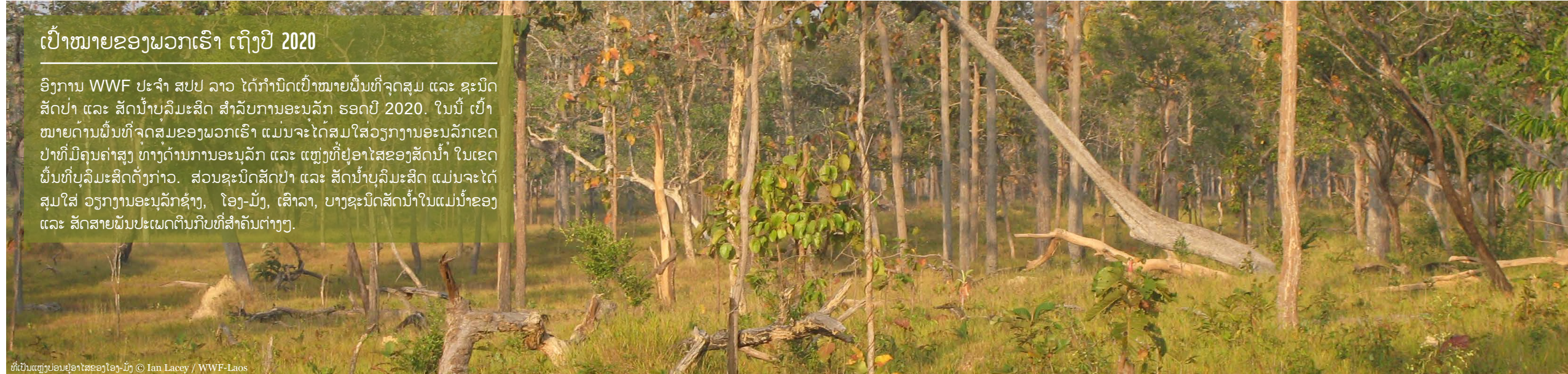
ທີ່ເປັນແຫຼ່ງບ່ອນຢູ່ອາໄສຂອງໂອງ-ມັງ

ອົງການ WWF ປະຈຳ ສປປ ລາວ ໄດ້ກຳນົດເປົ້າໝາຍພື້ນທີ່ຈຸດສຸມ ແລະ ຊະນິດສັດປ່າ ແລະ ສັດນ້ຳບຸລີມະສິດ ສຳລັບການອະນຸລັກ ຮອດປີ 2020. ໃນນີ້ ເປົ້າໝາຍດ້ານພື້ນທີ່ຈຸດສຸມຂອງພວກເຮົາ ແມ່ນຈະໄດ້ສຸມໃສ່ວຽກງານອະນຸລັກເຂດປ່າທີ່ມີຄຸນຄ່າສູງ ທາງດ້ານການອະນຸລັກ ແລະ ແຫຼ່ງທີ່ຢູ່ອາໄສຂອງສັດນ້ຳ ໃນເຂດພື້ນທີ່ບຸລີມະສິດດັ່ງກ່າວ. ສ່ວນຊະນິດສັດປ່າ ແລະ ສັດນ້ຳບຸລີມະສິດ ແມ່ນຈະໄດ້ສຸມໃສ່ ວຽກງານອະນຸລັກຊ້າງ, ໂອງ-ມັງ, ເສົາລາ, ບາງຊະນິດສັດນ້ຳໃນແມ່ນ້ຳຂອງ ແລະ ສັດສາຍພັນປະເພດຕົ້ນກີບທີ່ສຳຄັນຕ່າງໆ.