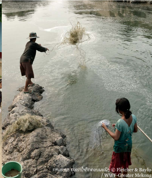
ການຫາປາ ຢູ່ເຂດນ້ຳຕົກຄອນນະເັນຍັງ