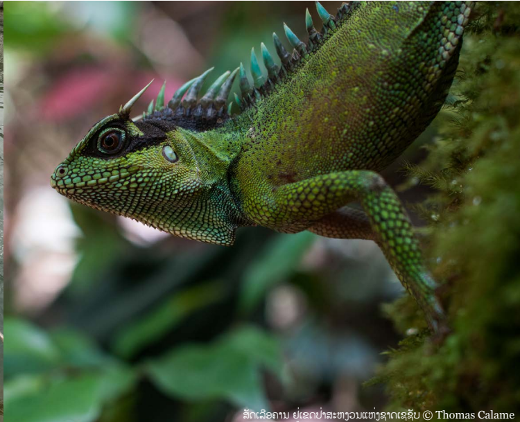
ສັດເລືອຄານ ຢູ່ເຂດປ່າສະຫງວນແຫ່ງຊາດເຊຊັບ