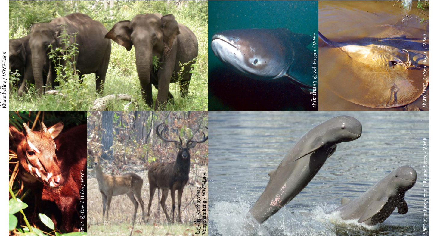
ອົງການ WWF ປະຈຳ ສປປ ລາວ ໄດ້ກຳນົດເອົາ 3 ຊະນິດພັນສັດປີກ ແລະ ສັດນ້ຳຈືດສະເພາະຖິ່ນຂະໜາດໃຫຍ່ຈຳນວນໜຶ່ງ ເປັນບຸລິມະສິດຂອງການອະນຸລັກ ໃນແຜນຍຸດທະສາດ ໄລຍະ ແຕ່ປີ 2015-2020.

ເພື່ອໃຫ້ຍຸດທະສາດ (ວິທີການອະນຸລັກ) ເຫຼົ່ານີ້ ປະກົດຜົນເປັນຈິງ, ພວກເຮົາຈະຕ້ອງຮັບປະກັນ ໃຫ້ວຽກງານຂອງເຮົາ ໄດ້ສະແດງໃຫ້ເຫັນເຖິງຜົນໄດ້ຮັບ ແລະ ວິທີປະຕິບັດທີ່ດີ ກ່ຽວກັບ ວຽກງານອະນຸລັກ, ພ້ອມກັບການຊ່ວຍສ້າງຄວາມເຂັ້ມແຂງໃຫ້ນະໂຍບາຍຂອງພາກລັດ, ເຊື່ອມສານວິທີການອະນຸລັກຂອງພວກເຮົາ, ສ້າງສາຍພົວພັນວຽກງານກັບພາກສ່ວນທີ່ກ່ຽວຂ້ອງໃຫ້ເຂັ້ມແຂງ, ສ້າງການພົວພັນກັບຫົວໜ່ວຍທຸລະກິດ ຕາມຄວາມເໝາະສົມ ແລະ ປຸກຝັງຈິດສຳນຶກຂອງປະຊາຊົນ. ທັງຫມົດເຫລົ່ານັ້ນ ແມ່ນເປັນການສະໜັບສະໜູນໃຫ້ຈັດຕັ້ງປະຕິບັດໂຄງການອະນຸລັກທີ່ມີຈະສາມາດກ້າວໄປສູ່ຄວາມຍືນຍົງ ແລະ ມີສະຖຽນລະພາບໃນໄລຍະຍາວໄດ້ເປັນຢ່າງດີ.