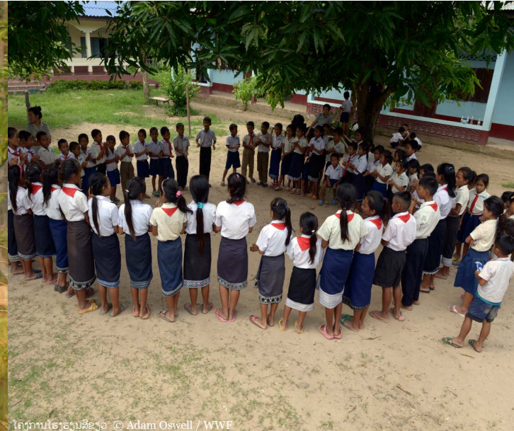
ໂຄງການໂຮງຮຽນຊ້າງ